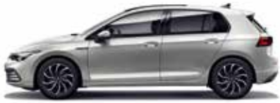
Reflex Silver Metallic