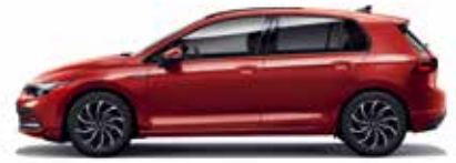
King Red Metallic