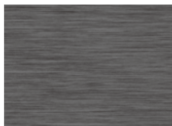
'Brushed Dark Metal'