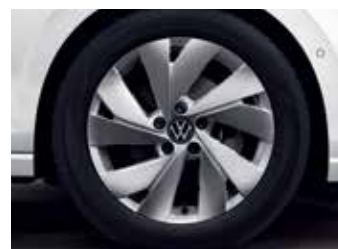
'Nottingham' 7.5J x 17" alloy wheels 225/45 R17 tyres (Premium 적용)