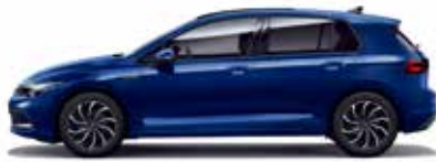
Atlantic Blue Metallic