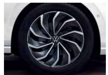
'Ventura' 7.5J x 17" alloy wheels 225/45 R17 tyres (Prestige 적용)