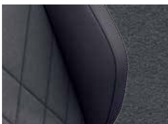
'Art Velours' Seat Soul Black