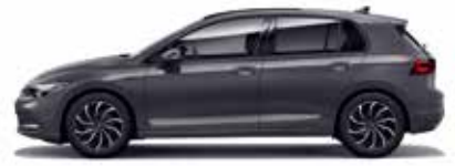
Dolphin Gray Metallic