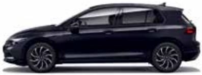
Deep Black Pearl Effect